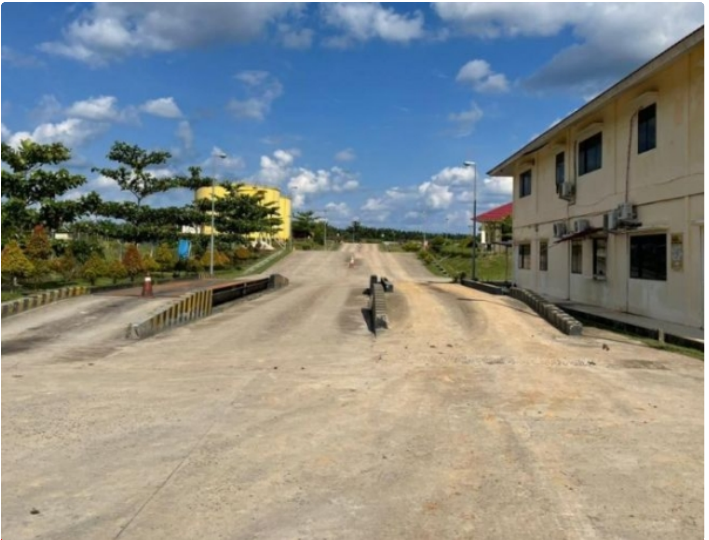
Pabrik PT Berkala Maju Bersama (PT BMB) Kecamatan Manuhing Kabupaten Gunung Mas

PALANGKA RAYA - Kisruhnya keadaan perusahaan yang bergerak di bidang perkebunan kelapa sawit di Kecamatan Manuhing Kabupaten Gunung Mas (Gumas), Kalimantan Tengah (Kalteng) yaitu PBS PT Berkala Maju Bersama (PT BMB).