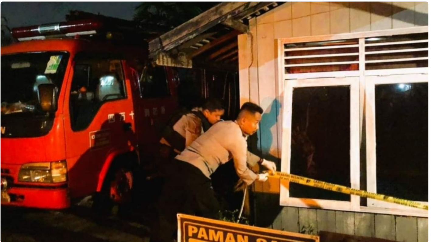
Polresta Palangka Raya Mempoliceline Lokasi Rumah Yang Telah Terjadinya Pembunuhan Pasutri Di Jalan Kenanga Palangka Raya

PALANGKA RAYA - Kepolisian Resor Kota Palangka Raya, Polda Kalteng segera melakukan penyelidikan terhadap peristiwa meninggal dunianya pasangan suami istri (pasutri) yang diduga menjadi korban pembunuhan.