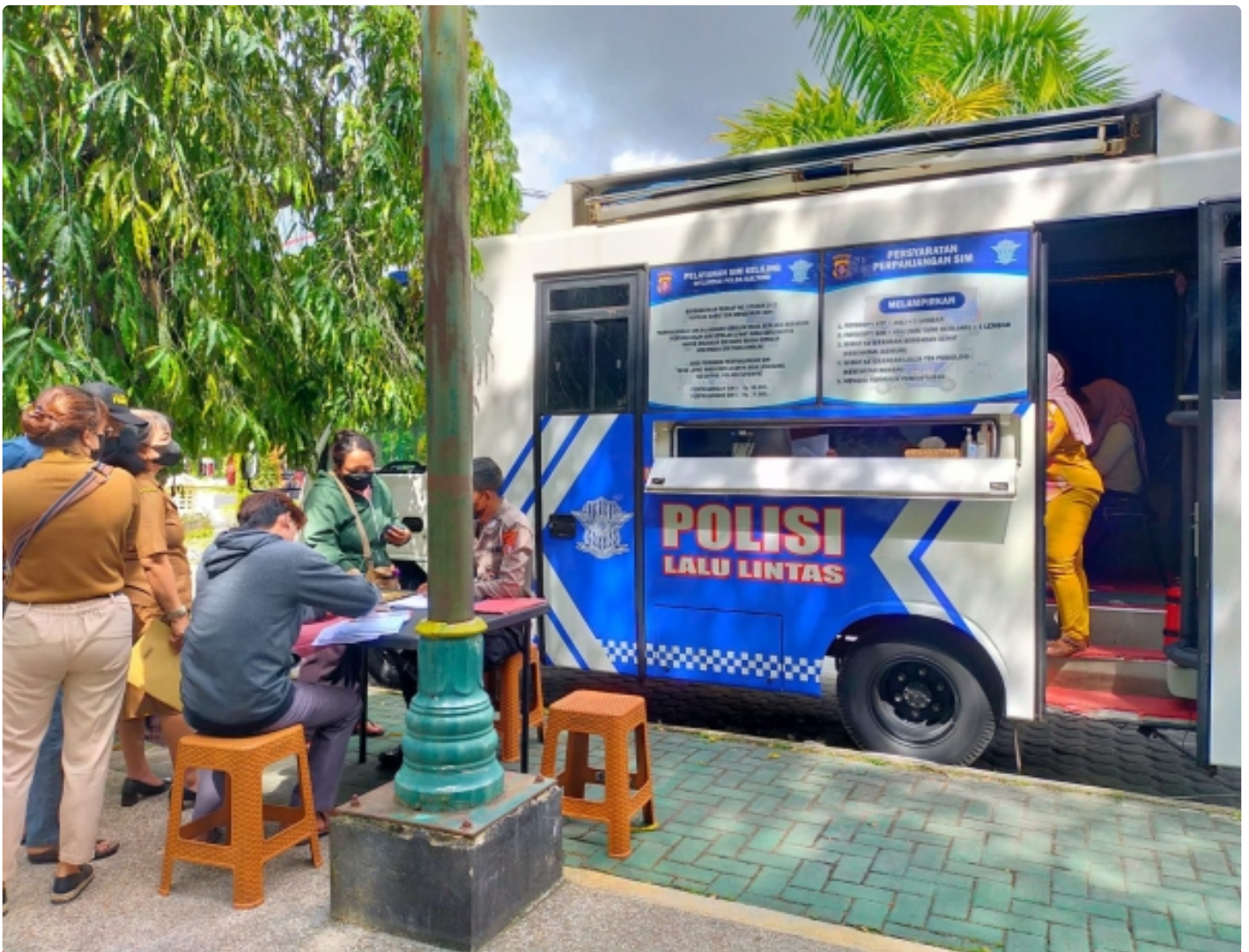
Bus Keliling Dirlantas Polda Kalteng

PALANGKA RAYA - Direktorat Lalu Lintas (Ditlantas) Polda Kalteng berikan pelayanan Surat Ijin Mengemudi (SIM) keliling bagi masyarakat Kota Palangka Raya. Selasa (6/12/2022) Pagi.